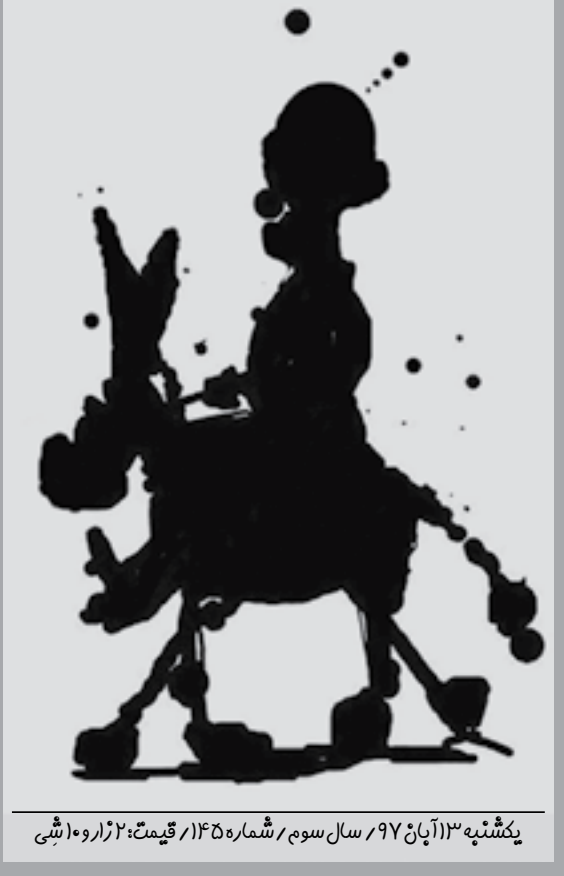
یکشنبه ۳۱ آبان ۹۷ / سال سوم / شماره ۱۴۵ / قیمت: ۲۰ هزاره اوشی

می ززم هی حرف حق را، هر چه بادا، هر چه باد